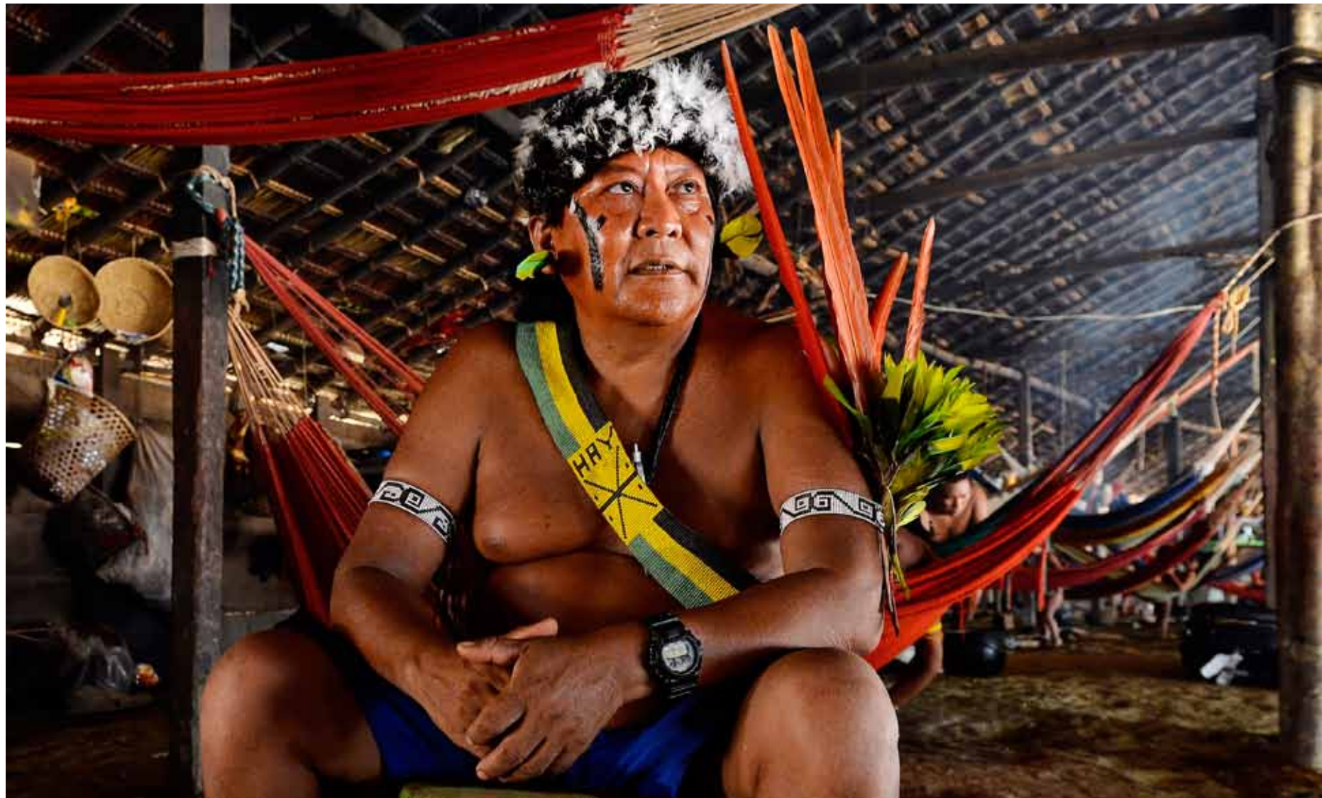
HØVDINGEN. Davi Kopenawa Yanomami er yanomamienes ubestridte leder og en av verdens mest kjente urfolkforkjemper. Han er ikke redd for å ta opp kampen mot gullgraverne. - Folk sier det vi gjør er farlig, men det som er i fare, er drømmene våre, livene våre. Jeg vil hjelpe denne kampen, men jeg kjemper ikke med våpen. Jeg kjemper med ord, sier Kopenawa.