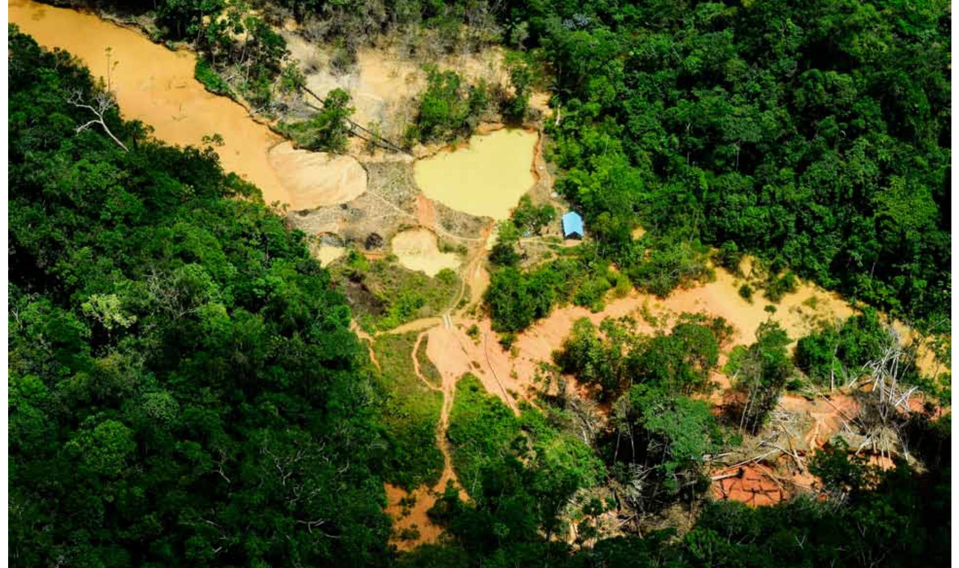
GARIMPEIROS. Illegale gullgravere forgifter elvene og havner i konflikt med indianere. Denne leiren - én av flere tusen i Amazonas - ble like etter ryddet av myndighetene. Men gullgraverne kommer alltid tilbake.

→ - Dette er som å komme hjem. Her føler jeg meg trygg, sier han.