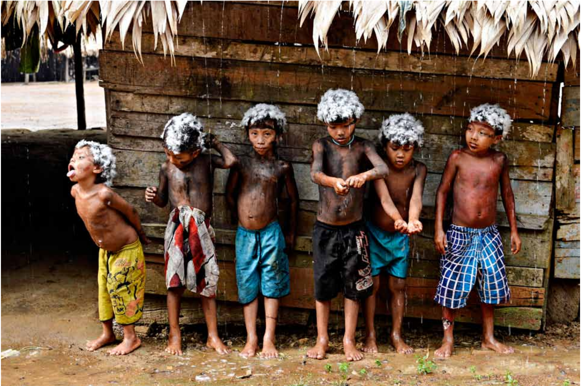
SKOGENS GUTTER. Barn i Demini viser frem den siste surfemoten mens de redder kroppsmalingen fra et kraftig regnskyl. Mer kontakt med utenverden har fått stadig flere av de tradisjonelt nakne yanomamiene til å trekke i klær.

➔ - Myndighetene har ingen kontroll over territoriet sitt, og gullgraverne tørst etter ny rikdom lar seg ikke slukke. Fortsetter det slik, er jeg redd mange flere av oss blir drept. Jeg er redd yanomamiene blir utryddet, sier han.