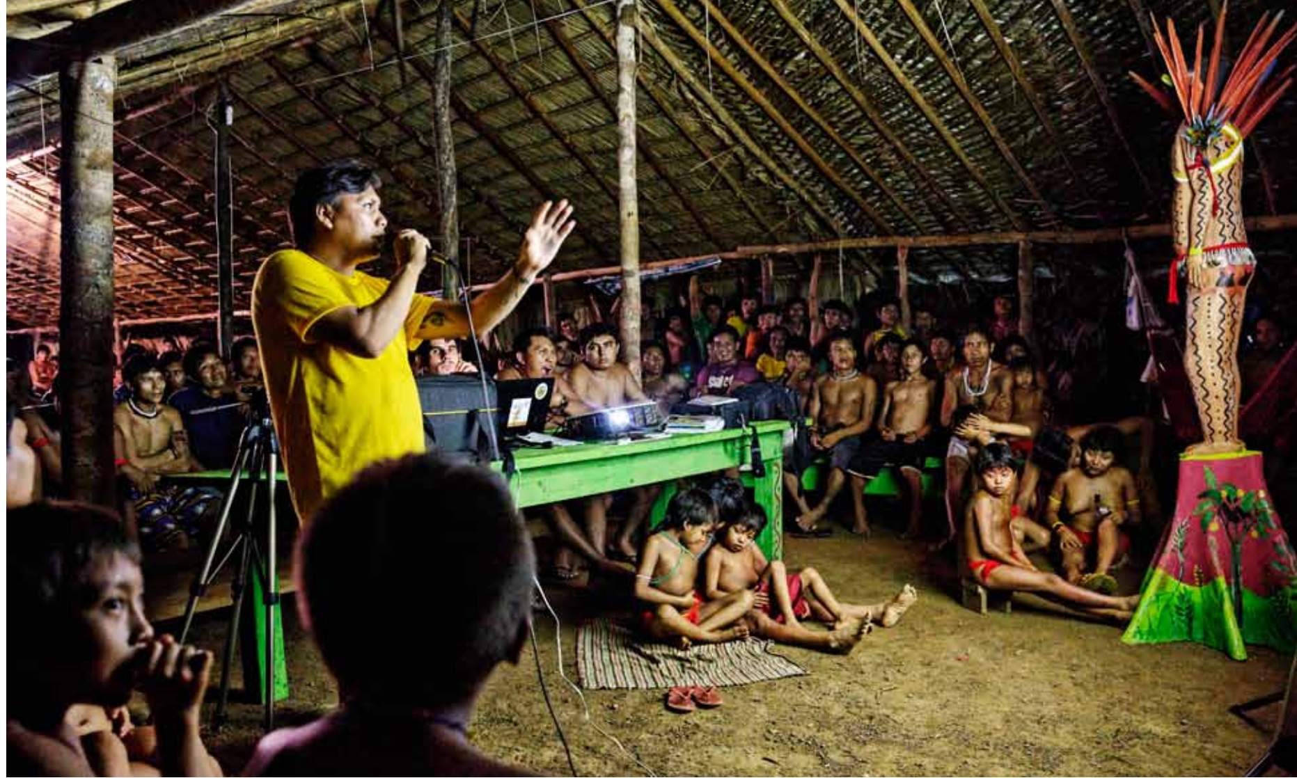
GENERALFORSAMLING. Ved hjelp av et aggregat og en projektor forteller representanter for yanomamilandsbyer over hele det nordlige Amazonas om truslene de sammen må bekjempe. Gullgravere er den aller største.